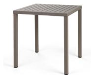
TORTORA vern. tortora 47859.10.000