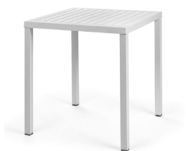
BIANCO vern. bianco 47853.00.000

PT Mesa empilhável 70x70 cm. Material: tampo DurelTOP em polipropileno com tratamento anti-UV colorido na totalidade. Pernas em alumínio pintado. Acabamento fosco. Pés ajustáveis. Resina reciclável.