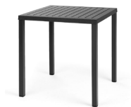
ANTRACITE vern. antracite 47852.02.000