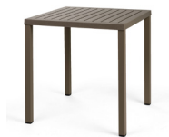
TABACCO vern. tabacco 47867.53.000